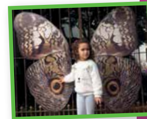
Photo & artiste : Lourdes Sakotani Vigia - vigiado - vigilante (la veille, le gardé, vigilant)

> Adresse postale : RESO ASSO METRO C/O Béatrice Auxent, Présidente de Berkem Label 56 rue du Pré Catelan, 59110 La Madeleine