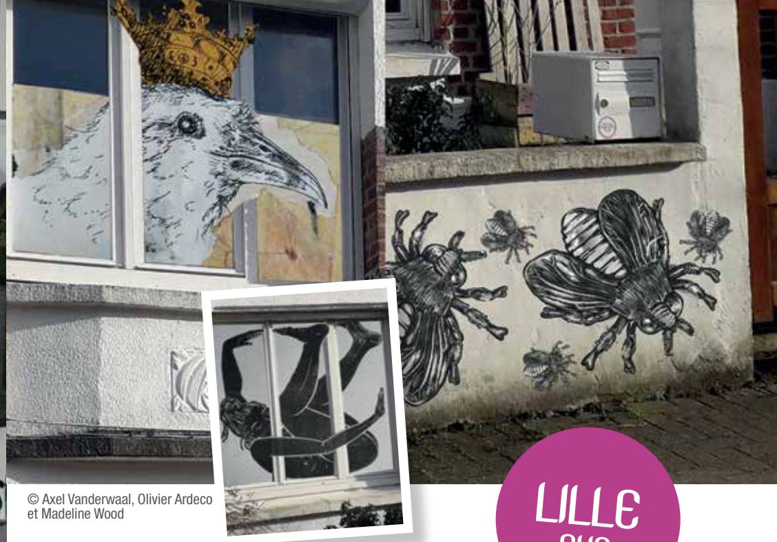
© Axel Vanderwaal, Olivier Ardeco et Madeline Wood

Le collectif "la vie d'artiste" est composé par le Conseil de quartier Résidence, Ecole primaire Rameau, la Maison de quartier La maison des Genêts, la bibliothèque Place de Verdun et les habitants du quartier, avec le soutien de la Ville de Villeneuve d'Ascq.