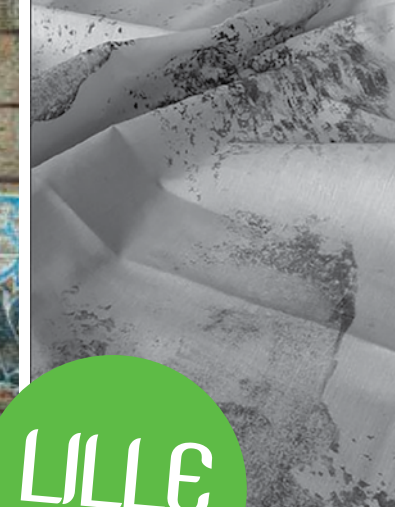
© Patricia Zygomalas, Caroline Polikar, Emilie Pillot