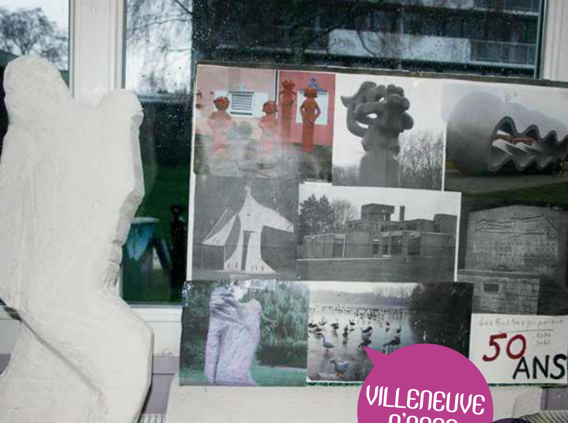
Artiste : J Wattelet